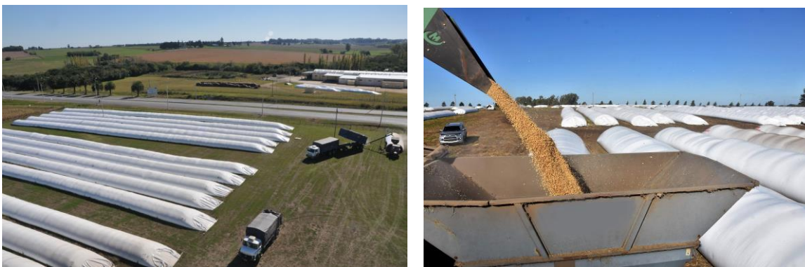
Figura 1. IZQ y DER. Conjuntos de silos bolsa en las llanuras uruguayas