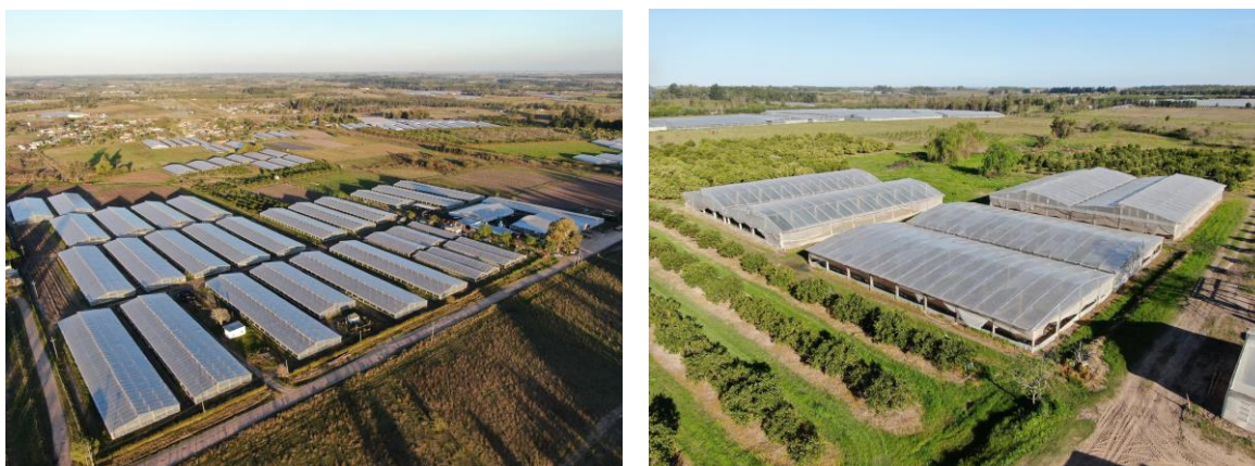
Figura 3. IZQ y DER. Conjuntos de invernaderos en la Provincia de Salto, Uruguay